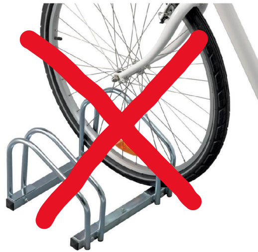
NON ! (Pince-roues)