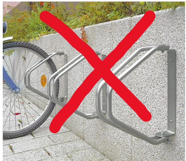
NON ! (pince roues)